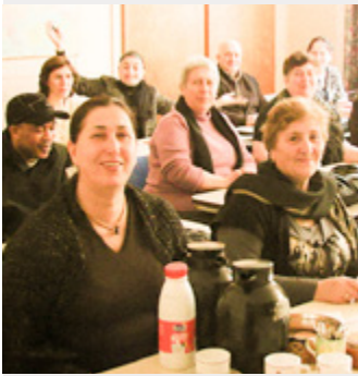
| De loodsen vzw-asbl

Anno 2016 is het nodig dat privéschenkers begrijpen dat hun gift ook gebruikt kan worden voor de financiering van het salaris van medisch-sociaal personeel, in België of elders.