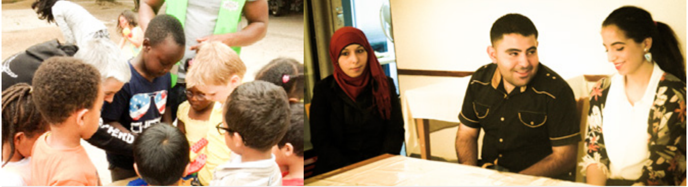
| 't Lampeke vzw-asbl