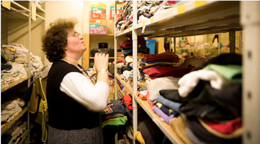
| Nasci vzw-asbl

63 % van het totale budget 2014 van de organisaties 2014 gaat naar organisaties die armoede in de Derde Wereld bestrijden, 26 % gaat naar sociale actie in België.